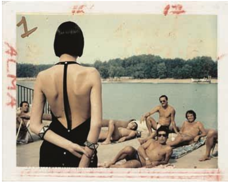
3. Helmut Newton Amica , Milan 1982 (Polacolor)