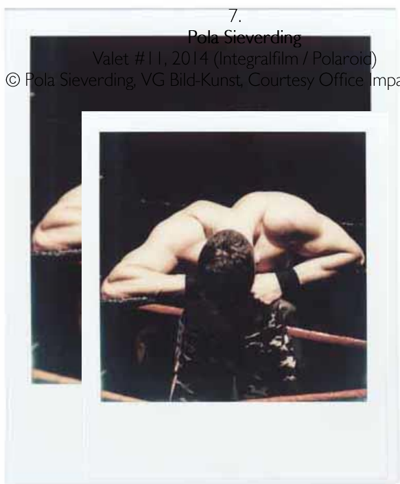
7. Pola Sieverding Valet #11 , 2014 (Integralfilm / Polaroid)