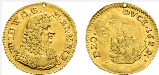
Brandenburg-Preußen: Friedrich Wilhelm der Große Kurfürst, 1682

Dukat, Gold, 23 mm, Inv. Nr. 18273618 Staatliche Museen zu Berlin, Münzkabinett