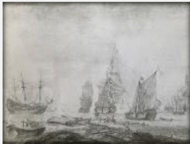
Casper van den Bos Schiffe im Hafen vor Hoorn, 1655

Öl auf Holz, 36,9 x 28 cm Hoorn, Westfries Museum