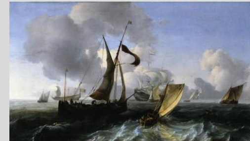
Willem van de Velde d.J. Eine Kaag und andere Segler bei auffrischem Wind , 1660-1707

Öl auf Leinwand, 57,5 x 98,4 cm, Kat.Nr. 895 Staatliche Museen zu Berlin, Gemäldegalerie