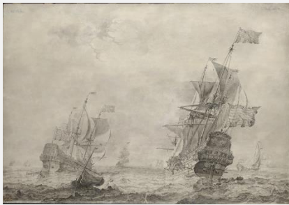
Olfert de Vrij Dreimaster auf leicht bewegter See , 1665 Öl auf Holz, 97,4 x 139,8 cm, Kat.Nr. II.367 Staatliche Museen zu Berlin, Gemäldegalerie