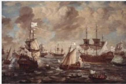
Lieve Verschuier Kurbrandenburgische Flotte, 1684

Öl auf Leinwand, 167 x 244 cm, Inv. Nr. GK I 987 Stiftung Preußische Schlösser und Gärten Berlin- Brandenburg, Schloss Oranienburg