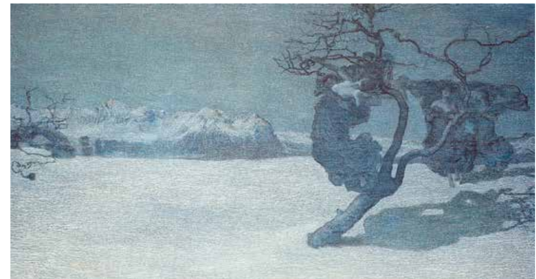
Abb. 5 Jan Toorop Zwei Frauen, 1893, Mischtechnik auf Papier, 24,5 × 37,5 cm, Privatsammlung