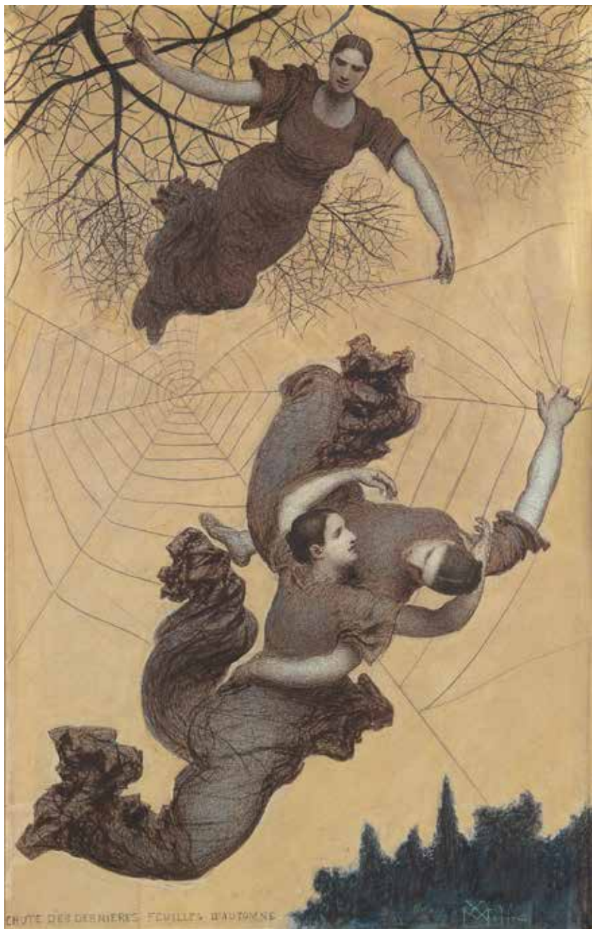
Abb. 3 Xavier Mellery Der Herbst, um 1890, Mischtechnik auf Papier auf Karton, 92 × 59 cm, Musées royaux des Beaux-Arts de Belgique, Brüssel

große Anregungen empfing, lehnten zwar die Beteiligung an den Ausstellungen von Les XX ab, 20 aber Khnopff war es ein Anliegen, die Bekanntheit dieser Künstler auch in Belgien zu steigern. 21 Er selbst zeigte seine Arbeiten bereits ab 1886 in London, stand im engen Austausch mit Burne-Jones (S. 128) 22 und berichtete umgekehrt ab 1895 als regulärer Korrespondent der englischen Zeitschrift The Studio aus Brüssel. Sein plastisches Werk orientierte sich an dem des Engländers George Frampton, etwa dessen 1894 auf der ersten Ausstellung von La Libre Esthétique präsentierte Mysteriarchin (S. 166 und 167). In Paris avancierte Khnopff, dem der Ruf als »Obermystiker von Brüssel« 23 voraus-