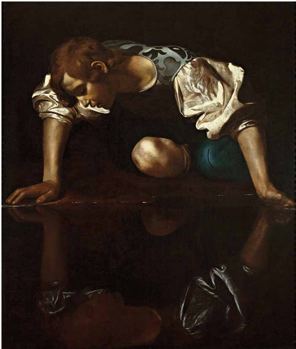
Abb. 8 Caravaggio Narziss, um 1600, Öl auf Leinwand, 113,3 × 95 cm, Galleria Nazionale d'Arte Antica, Palazzo Barberini, Rom

und Sexualität, zwischen Lebens- und Todestrieb«. 36 Als Ergebnis wurden die Triebe als Motor menschlichen Handelns erkannt. Freud diagnostizierte eine Trias aus unbewusst trieb- und wunschgesteuertem Es, dem an der Realität abgeglichenen, bewusst handelnden Ich und der kontrollierenden moralischen Instanz des Über-Ichs. Diese Aufteilung des Subjekts fügte sich in das allgemeine Bild einer fragmentierten Welt. Neben der Entthronung des Menschen durch Charles Darwins Abstammungstheorie Mitte des 19. Jahrhunderts war das wohl die zweite große Enttäuschungserfahrung der Moderne. Der Mensch, ein von sich selbst entfremdetes Wesen: So lautete gegen Ende des Jahrhunderts Freuds Befund.