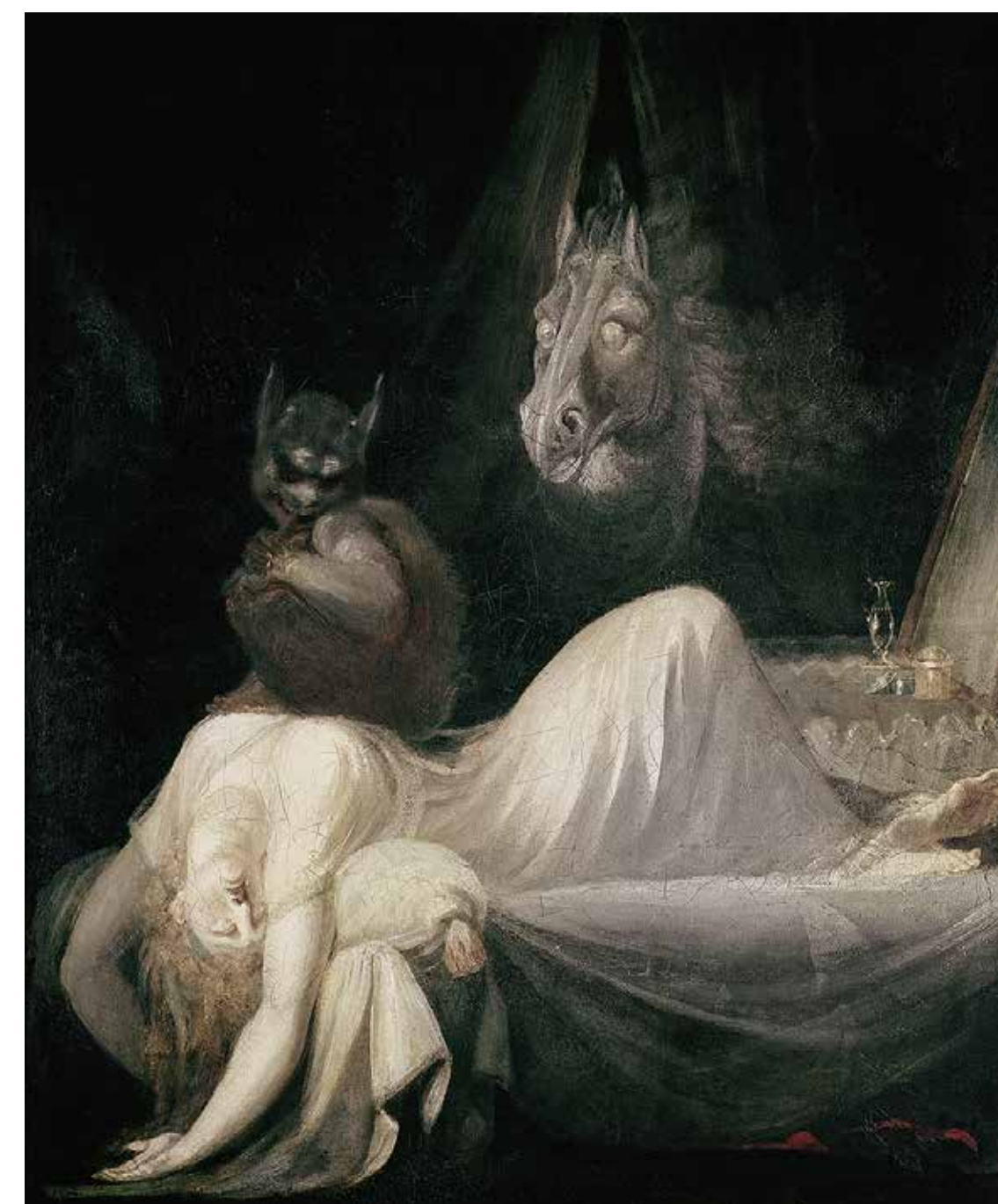
Abb. 7 Johann Heinrich Füssli Der Nachtmahr, 1790/91, Öl auf Leinwand, 76,5 × 63,6 cm, Frankfurter Goethe-Haus – Freies Deutsches Hochstift

seinem obszön-morbiden Sardanapal . 33 Davon überzeugt, dass das Geheimnis der Welt im eigenen Ich liege, drängte sich zugleich die Angst vor den dort lauenden Ungeheuern der Fantasie auf. 34 Zu diesen düsteren Träumen traten nun die Erkenntnisse aus den wissenschaftlichen Erkundungen der menschlichen Psyche hinzu. Sigmund Freud ging davon aus, »daß Träume deutbar seien, das heißt einen verborgenen Sinn hätten«. 35 Seine 1899 veröffentlichte Traumdeutung vereinigte und verwissenschaftlichte zahlreiche der im 19. Jahrhundert vorhandenen Überlegungen und entwickelte auch kulturgeschichtlich enormen Einfluss. Nach Freud ist das Unbewusste der Bereich der verdrängten, vom Bewusstsein nicht zugelassenen Inhalte und Triebe, von dem auch emotionale Störungen ausgehen können. Er untersuchte »die krankheitsbildende Macht der Verdrängung und die Ursprünge des moralischen Kontrollsystems, die Anatomie von Angst und Wahn, die Spannung zwischen Vernunft