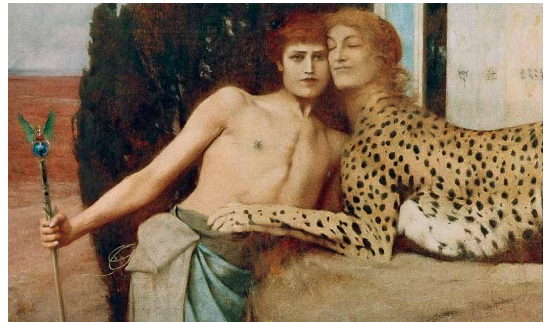
Abb. 1 Fernand Khnopff Liebkosungen (Detail), 1896, Öl auf Leinwand, 50 × 150 cm, Musées royaux des Beaux-Arts de Belgique, Brüssel

Das ausgehende 19. Jahrhundert war ein typisches Zeitalter des Übergangs und der Dekadenz. Die Erosion der alten Traditionen und gesellschaftlichen Konventionen durch Industrialisierung und soziale Konflikte führte in den Augen vieler zur Frag-