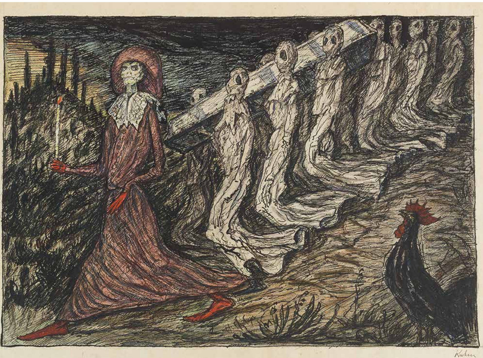
Abb. 6 Alfred Kubin Trauermarsch, um 1910, Mischtechnik auf Papier, 24,5 × 37,5 cm, Leopold Privatsammlung

1880er-Jahren aufeinander. Hier können die Impressionisten und Neoimpressionisten einerseits und die symbolistisch Inspirierten andererseits als zwei wesentliche Gruppen benannt werden, die sich parallel entwickelten. Dass verschiedene Strömungen moderner Kunst nebeneinander existierten, war nicht ungewöhnlich im 19. Jahrhundert, vielmehr ist es geradezu ein Signum dieses Zeitalters. Die Moderne nicht als Singular, sondern im Sinne von zeitgleichen Möglichkeiten zu begreifen ist jedoch keine heutige Entdeckung. Kunstkritiker und Schriftsteller wie Huysmans oder Baudelaire haben Edgar Degas und die Impressionisten als Maler des modernen Lebens bewundert und zugleich die Symbolisten als Entdecker der Traumwelten. Das Festhalten des flüchtigen Sinesindrucks von Licht und Farben im Alltäglichen erscheint als ein grundverschiedener Ansatz gegenüber jenem der weltabgewandten Suche nach dem Extraordinären und Rätselhaften, den-