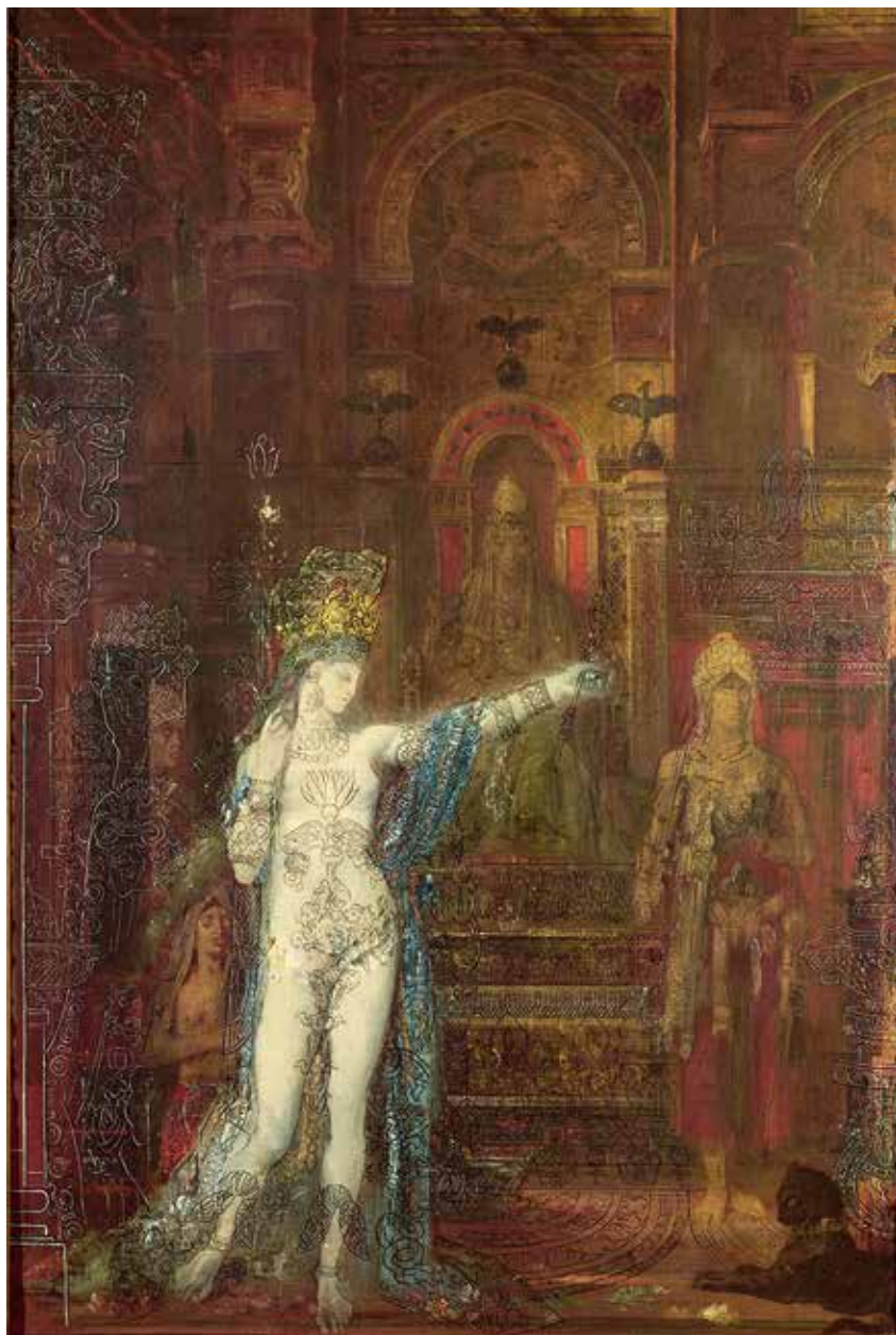
Abb. 9 Gustave Moreau Tanzende Salome (Tätowierte Salome), um 1874, Öl auf Leinwand, 92 × 60 cm, Musée Gustave Moreau, Paris

betitelt sein Selbstbildnis vor großem Landschaftsausschnitt von 1881 bezeichnenderweise Eine Krise . 44 Sind in diesen Beispielen schon die Titel programmatisch, so erscheinen die obsessiv wiederholten Selbstbetrachtungen Spilliaerts wie Dokumentationen eines körperlichen Zerfalls, wobei die zunehmend gespenstisch wirkenden Momentaufnahmen in ihrer Expressivität eher das Innere nach außen kehren und damit auf den seelischen Zustand des Künstlers schließen lassen (S. 283–286). Als »das unrettbare Ich« bezeichnete Ernst Mach in einer Abhandlung von 1885 die in die Krise geratene und damit instabile Identität des Subjekts. 45 Diese Auflösung des Individuums scheint in Ensors Darstellung seiner selbst als skelettierter Maler im blauen Anzug einen äquivalenten künstlerischen Ausdruck gefunden zu haben (S. 280 f.).