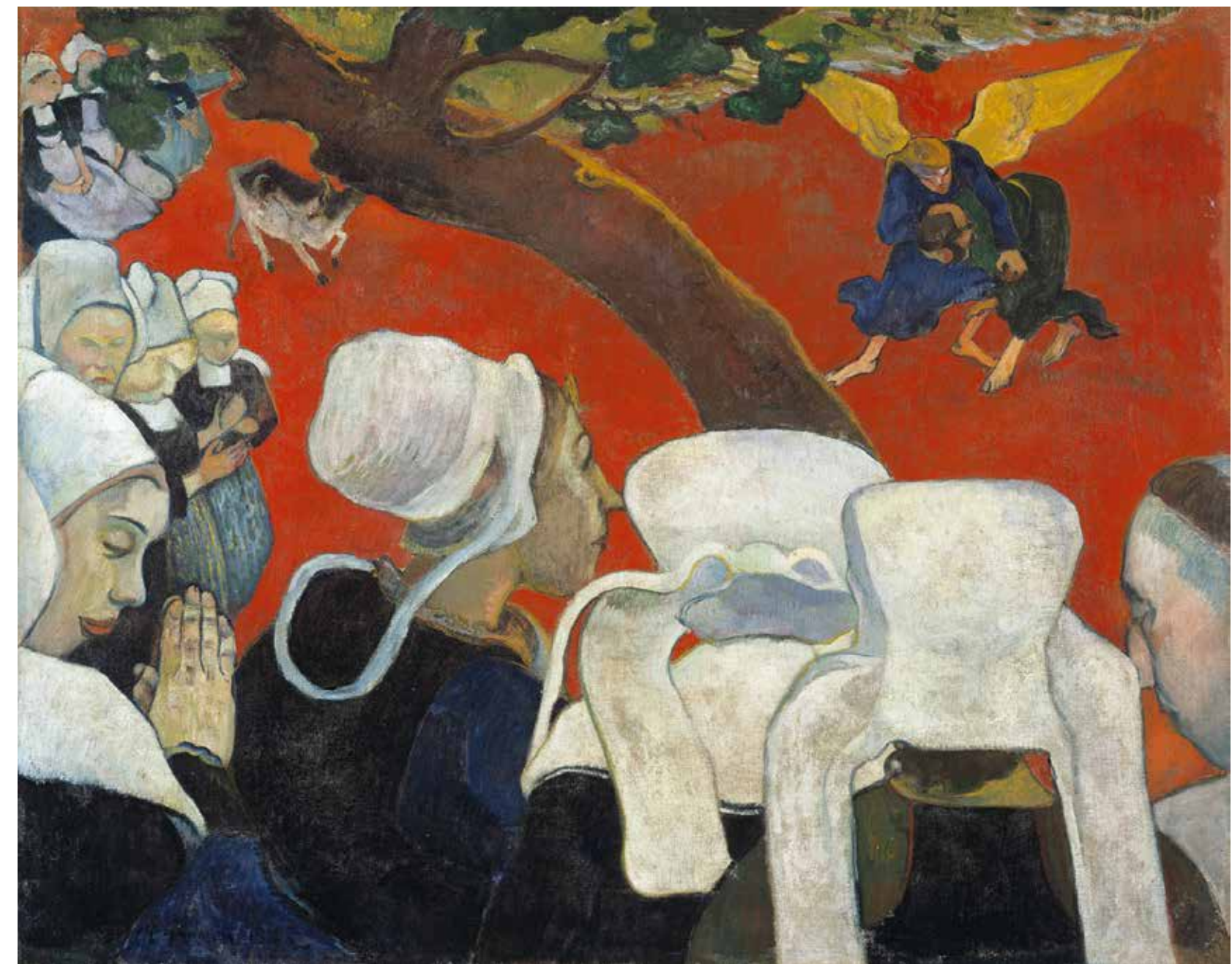
Abb. 2 Paul Gauguin Die Vision nach der Predigt (Der Kampf Jakobs mit dem Engel), 1888, Öl auf Leinwand, 74,4 × 93,1 cm, National Gallery of Scotland, Edinburgh

Ausdrucksformen des Symbolismus in Literatur, Musik und bildender Kunst enthält. Maler wie Gustave Moreau und Odilon Redon sind darin ebenso zentral wie die Literatur von Charles Baudelaire bis Gustave Flaubert, Stéphane Mallarmé und Jules Barbey d'Aurevilly. Dass Huysmans hiermit der Analyse und den Versuchen der theoretischen Fassung dieser Zeitströmung vorgegriffen hat, verwundert kaum, war er doch schon vor seiner schriftstellerischen Arbeit als Kunstkritiker bekannt. Es sollte allerdings Jean Moréas mit seinem 1886 im Pariser Figaro erschienenen Artikel »Le Symbolisme« 9 vorbehalten sein, eine erste programmatische Definition des Symbolismus vorzulegen. Während diese im Wesentlichen auf Literatur bezogen war, übertrug der Belgier Émile Verhaeren sie 1887 in einem Artikel zu Fernand Khnopff auf die Malerei. 10