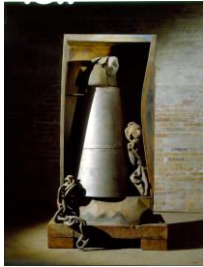
Anthony Caro Poison Chamber / Giftkammer 1995-1999 Steingut, Beton, Holz, Messing und Stahl 209,5 x 118 x 78,5 cm Inv.Nr. 5437