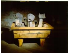
Anthony Caro Sacrifice / Opfer 1995-1999, Steingut, Beton, Holz, Messing und Stahl 126 x 150 x 109 cm, Inv.Nr. 5430