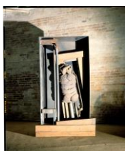
Anthony Caro Judas 1995-1999 Steingut, Beton, Holz, Messing und Stahl 207 x 118 x 71 cm Inv.Nr. 5435

GENERALDIREKTION PRESSE – KOMMUNIKATION – SPONSORING