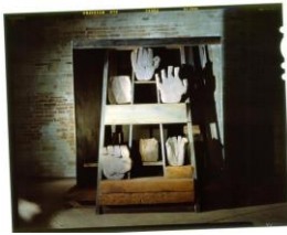
Anthony Caro Tribunal 1995-1999, Steingut, Beton, Holz, Messing und Stahl 224 x 218,5 x 137 cm, Inv.Nr. 5436