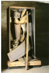
Anthony Caro Charon 1995-1999 Steingut, Beton, Holz, Messing und Stahl 208 x 123 x 101,5 cm Inv.Nr. 5419