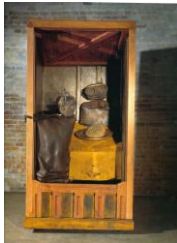
Anthony Caro Salomé Dances / Salomé tanzt 1995-1999 Steingut, Beton, Holz, Messing und Stahl 211 x 104 x 169 cm Inv.Nr. 5431