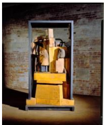
Anthony Caro Torture Box / Folterkammer 1995-1999 Steingut, Beton, Holz, Messing und Stahl 208,5 x 110,5 x 95 cm Inv.Nr. 5426