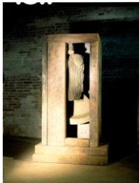
Anthony Caro Teiresias 1995-1999 Steingut, Beton, Holz, Messing und Stahl 209 x 120 x 93 cm Inv.Nr. 5425