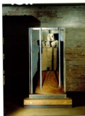
Anthony Caro Prisoners / Gefangene 1995-1999 Steingut, Beton, Holz, Messing und Stahl 205 x 202 x 82,5 cm Inv.Nr. 5432