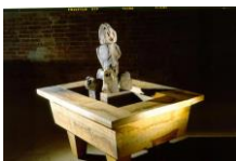
Anthony Caro Still Life - Skulls / Stilleben - Schädel 1995-1999, Steingut, Beton, Holz, Messing und Stahl 155 x 111 x 152 cm, Inv.Nr. 5427