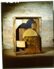
Anthony Caro Elysian Fields / Die Elysischen Gefilde 1995-1999 Steingut, Beton, Holz, Messing und Stahl 210 x 164 x 87,5 cm Inv.Nr. 5424