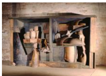
Anthony Caro Civil War / Bürgerkrieg 1995-1999, Steingut, Beton, Holz, Messing und Stahl 206 x 375 x 104 cm, Inv.Nr. 5434