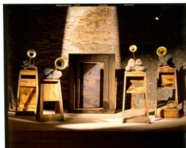
Anthony Caro The Last Trump / Die Posaunen des Jüngsten Gerichts , 1995-1999 4 Skulpturen: Steingut, Beton, Holz, Messing und Stahl, a: 223,5 x 70 x 210 cm, b: 183 x 63,5 x 170 cm, c: 214 x 68,5 x 175 cm, d: 228,5 x 71,5 x 186 cm, Inv.Nr. 5440