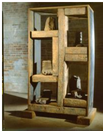
Anthony Caro Jacob's Ladder / Die Jakobsleiter 1995-1999 Steingut, Beton, Holz, Messing und Stahl 211 x 139,5 x 84,5 cm Inv.Nr. 5439