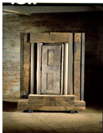
Anthony Caro The Door of Death / Das Tor des Todes 1995-1999 Steingut, Beton, Holz, Messing und Stahl 222 x 193 x 71 cm Inv.Nr. 5418