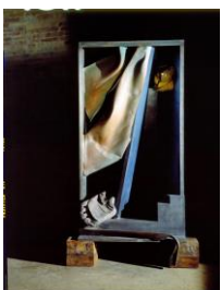
Anthony Caro Flesh / Fleisch 1995-1999 Steingut, Beton, Holz, Messing und Stahl 209 x 118 x 74 cm Inv.Nr. 5428

GENERALDIREKTION PRESSE – KOMMUNIKATION – SPONSORING