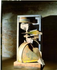
Anthony Caro The Furies / Die Furien 1995-1999 Steingut, Beton, Holz, Messing und Stahl 208,5 x 126 x 95 cm Inv.Nr. 5438