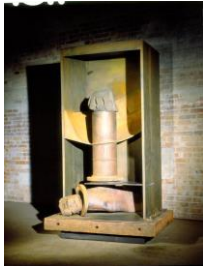
Anthony Caro Unknown Soldier / Der unbekannte Soldat 1995-1999 Steingut, Beton, Holz, Messing und Stahl 208 x 123 x 90 cm Inv.Nr. 5422