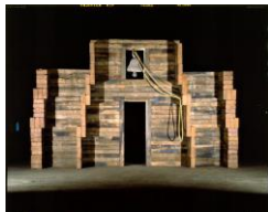
Anthony Caro The Bell Tower / Der Glockenturm 1995-1999 Steingut, Beton, Holz, Messing und Stahl 384 x 617 x 122 cm, Inv.Nr. 5417

Anthony Caro. The Last Judgement Sculpture der Sammlung Würth verlängert bis 1. November 2020