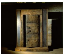
Anthony Caro Gate of Heaven / Das Himmelstor 1995-1999 Steingut, Beton, Holz, Messing und Stahl 237,5 x 185,5 x 69 cm Inv.Nr. 5441

GENERALDIREKTION PRESSE – KOMMUNIKATION – SPONSORING