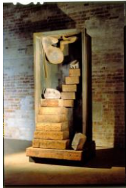
Anthony Caro Greed and Envy / Habgier und Neid 1995-1999 Steingut, Beton, Holz, Messing und Stahl 210 x 111 x 152 cm Inv.Nr. 5429