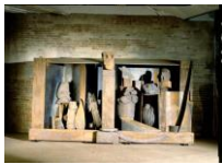
Anthony Caro Shades of Night / Die Schatten der Nacht 1995-1999, Steingut, Beton, Holz, Messing und Stahl 218 x 386 x 117 cm, Inv.Nr. 5423