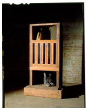
Anthony Caro Confession / Bekenntnis 1995-1999 Steingut, Beton, Holz, Messing und Stahl 206 x 113 x 64 cm Inv.Nr. 5433