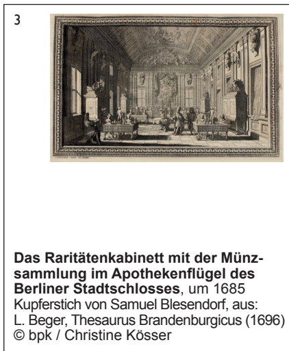
Das Raritätenkabinett mit der Münzsammlung im Apothekenflügel des Berliner Stadtschlosses, um 1685 Kupferstich von Samuel Blesendorf, aus: L. Beger, Thesaurus Brandenburgicus (1696)