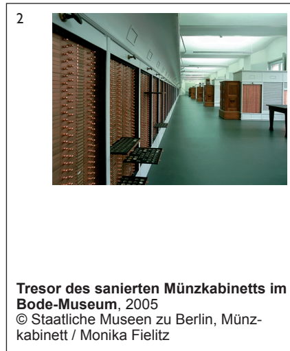
Tresor des sanierten Münzkabinetts im Bode-Museum, 2005