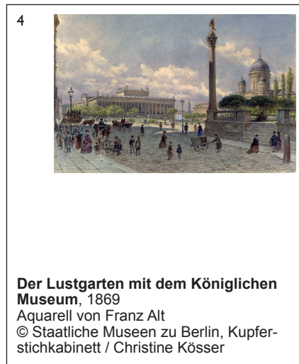
Der Lustgarten mit dem Königlichen Museum, 1869 Aquarell von Franz Alt