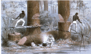
J. McGahey Fällen von Mahagonibäumen Lithografie, Liverpool, ca. 1850