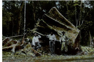
Wurzel eines gefällten Mahagonistamms mit Holzfällern historische Fotografie (Glasplattennegativ)