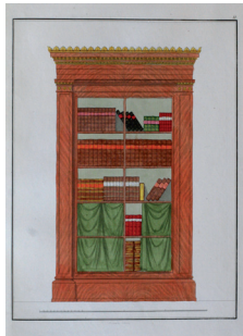
Bücherschrank mit Mahagoni furniert kolorierte Tafel, aus „Magazin für Freunde eines geschmackvollen Ameublements“, Berlin bei L.W. Wittich 1828-30