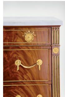
Kommode (Detail) Roentgenmanufaktur Neuwied, 1785/90

Die honorarfreie Reproduktion ist nur im Rahmen der aktuellen Berichterstattung zur Ausstellung bei Nennung der vollständigen Creditline erlaubt. Bei jeder anderweitigen Nutzung sind Sie verpflichtet, selbstständig die Fragen des Urheber- und Nutzungsrechts zu klären. Eine Weitergabe an Dritte ist nicht erlaubt. Bitte beachten Sie , dass bei digitaler Veröffentlichung alle Fotos die Auflösung von 758 x 512 Pixel und 72 dpi nicht überschreiten dürfen. Die Pressefotos sind 4 Wochen nach Ablauf der Ausstellung aus allen Onlinemedien zu löschen. Mit freundlicher Bitte um Zusendung eines Belegexemplars an die Pressestelle der Staatlichen Museen zu Berlin.