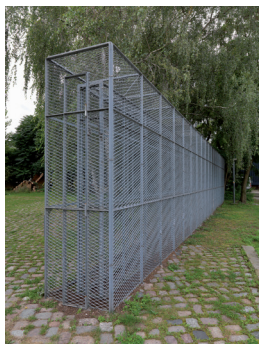
Bruce Nauman Double Cage Piece , 1974 / 2005 © Staatliche Museen zu Berlin, Nationalgalerie / Roman März © VG Bild-Kunst, Bonn 2018

Die honorarfreie Veröffentlichung ist nur im Rahmen der aktuellen Berichterstattung erlaubt (ab 3 Monate vor Ausstellungsbeginn bis 6 Wochen nach Ende der Ausstellung).