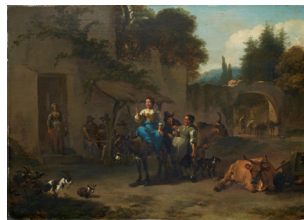
Nicolaes Berchem Die Rast vor dem Wirtshaus , 1657 Dauerleihgabe der Stiftung Heinz Kuckei Collections