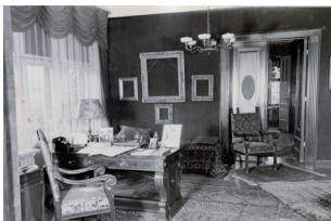
Walter Heilgendorffs Wohnung mit leeren Rahmen , nach Auslagerung der Bilder in einen Banksafe, 1941

Die honorarfreie Reproduktion ist nur im Rahmen der aktuellen Berichterstattung zur Ausstellung bei Nennung der vollständigen Creditline erlaubt. Bei jeder anderweitigen Nutzung sind Sie verpflichtet, selbstständig die Fragen des Urheber- und Nutzungsrechts zu klären. Eine Weitergabe an Dritte ist nicht erlaubt. Bitte beachten Sie , dass bei digitaler Veröffentlichung alle Fotos die Auflösung von 758 x 512 Pixel und 72 dpi nicht überschreiten dürfen. Die Pressefotos sind 4 Wochen nach Ablauf der Ausstellung aus allen Onlinemedien zu löschen. Mit freundlicher Bitte um Zusendung eines Belegexemplars an die Pressestelle der Staatlichen Museen zu Berlin.