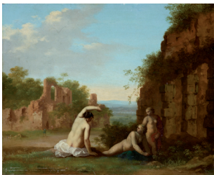
Cornelis van Poelenburch Römische Landschaft mit Nymphen , nach 1645 Dauerleihgabe der Stiftung Heinz Kuckei Collections