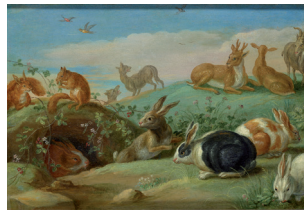
Jan van Kessel Landschaft mit Hasen , 1660-70 Dauerleihgabe der Stiftung Heinz Kuckei Collections