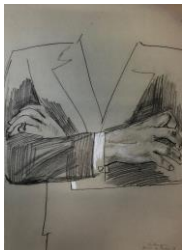
41. Hand- und Armstudie zum Bildnis Reber, 1929 schwarze Kreide, weiß gehöht 48,9 x 36 cm sign. u. l.: Beckmann bez.: Studie zu „Reber“ 29