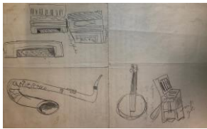
39. Jazzinstrumente, ca. 1928 Graphitstift, 33,7 x 21 cm n. bez., n. sign. Farbbezeichnungen im Blatt erworben 1943 im Atelier in Amsterdam

presse@smb.spk-berlin.de www.smb.museum/presse