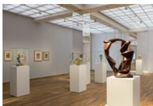
Rudolf Belling. Sculptures and Architectures Installation view Hamburger Bahnhof – Museum für Gegenwart – Berlin