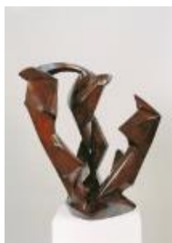
Rudolf Belling Triad, 1919-24 Wood, 91 x 77 x 77 cm

Staatliche Museen zu Berlin, Nationalgalerie © Nationalgalerie, SMB / Johann Clausen / VG Bild-Kunst, Bonn 2017