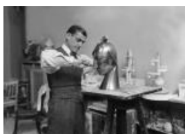
Rudolf Belling in his studio, around 1925

The press images can be downloaded in high resolution in the press room of the website www.rudolfbellinginberlin.de