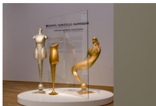
Rudolf Belling. Sculptures and Architectures Installation view Hamburger Bahnhof – Museum für Gegenwart – Berlin