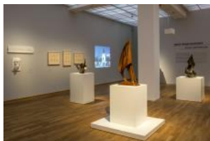
Rudolf Belling. Sculptures and Architectures Installation view Hamburger Bahnhof – Museum für Gegenwart – Berlin