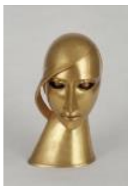
Rudolf Belling Kopf in Messing, 1925 Messing, 33,3 x 22,5 x 19 cm