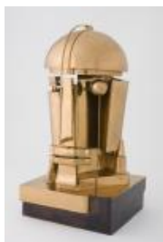
Rudolf Belling Skulptur 23, 1923 (Guss 1966) Messing, poliert, 41,5 x 21,5 cm

Staatliche Museen zu Berlin, Nationalgalerie Schenkung der Erben des Künstlers an die Freunde der Nationalgalerie