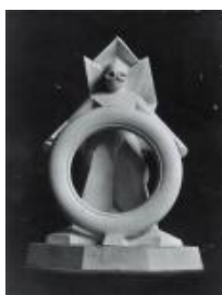
Rudolf Belling Reklamefigur für den Reifenhersteller Pneumatik Harburg-Wien an der AVUS- Rennbahn