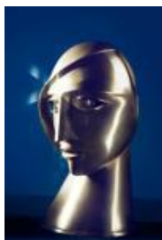
Rudolf Belling Kopf in Messing, 1925 Messing, 33,3 x 22,5 x 19 cm

Staatliche Museen zu Berlin, Nationalgalerie