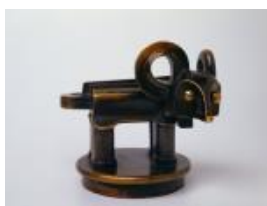
Rudolf Belling Fabeltier (Horchtier), 1923 Bronze, 9,5 x 11 x 9 cm

Staatliche Museen zu Berlin, Nationalgalerie