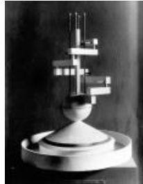
Rudolf Belling Wasserspiel für den Wintergarten im Haus Goldstein, 1923