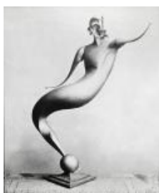
Rudolf Belling Moden-Plastik, Modell B, 1921

Staatliche Museen zu Berlin, Nationalgalerie Schenkung an die Freunde der Nationalgalerie