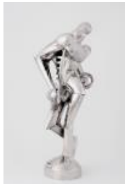
Rudolf Belling Organische Formen (Schreitender Mann), 1921 Bronze, versilbert, Höhe: 54 cm

Staatliche Museen zu Berlin, Nationalgalerie Schenkung der Erben des Künstlers an die Freunde der Nationalgalerie