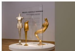
Rudolf Belling. Skulpturen und Architekturen Installationsansicht Hamburger Bahnhof – Museum für Gegenwart – Berlin