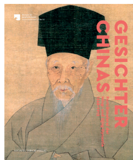
Gesichter Chinas. Porträtmalerei der Ming- und Qing-Dynastie (1368–1912), Titel des deutschen Ausstellungskatalogs, ISBN 978-3-7319-0587-5

Die honorarfreie Reproduktion ist nur im Rahmen der aktuellen Berichterstattung zur Ausstellung bei Nennung der vollständigen Creditline erlaubt. Bei jeder anderweitigen Nutzung sind Sie verpflichtet, selbstständig die Fragen des Urheber- und Nutzungsrechts zu klären. Eine Weitergabe an Dritte ist nicht erlaubt. Bitte beachten Sie , dass bei digitaler Veröffentlichung alle Fotos die Auflösung von 758 x 512 Pixel und 72 dpi nicht überschreiten dürfen. Die Pressefotos sind 4 Wochen nach Ablauf der Ausstellung aus allen Onlinemedien zu löschen. Mit freundlicher Bitte um Zusendung eines Belegexemplars an die Pressestelle der Staatlichen Museen zu Berlin.