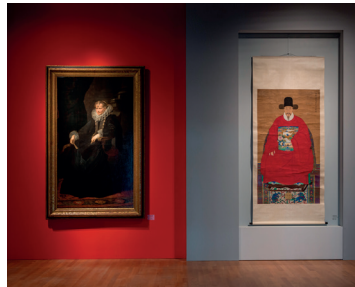
Gesichter Chinas. Porträtmalerei der Ming- und Qing-Dynastie (1368–1912), Ausstellungsansicht, 2017, © Staatliche Museen zu Berlin / David von Becker