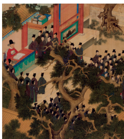
Yu Shi und Wu Yue, Die Beamtenlaufbahn des Xu Xianqing , 余士 吳鉞 徐顯卿宦蹟圖, Ming-Dynastie, Wanli-Ära (1573–1620), 1588, Album mit 26 Blättern, Tusche und Farben auf Seide, Palastmuseum Beijing, XIN 77917