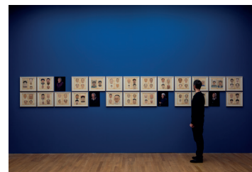
Gesichter Chinas. Porträtmalerei der Ming- und Qing-Dynastie (1368–1912), Ausstellungsansicht, 2017