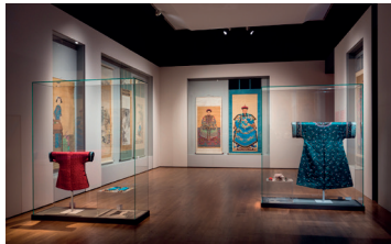
Gesichter Chinas. Porträtmalerei der Ming- und Qing-Dynastie (1368–1912), Ausstellungsansicht, 2017, © Staatliche Museen zu Berlin / David von Becker