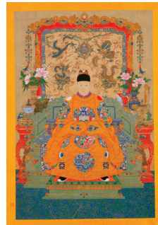
Unbekannter Hofmaler, Porträt des Tianqi-Kaisers (Xizong, Zhu Youjiao) im Hofgewand , 佚名 明熹宗朱由校朝服像, Ming-Dynastie, Tianqi-Ära (1621–1627), Hängerolle, Tusche und Farben auf Papier, Palastmuseum Beijing, GU 6209, © The Palace Museum, Foto: Yu Ningchuan