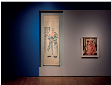
Gesichter Chinas. Porträtmalerei der Ming- und Qing-Dynastie (1368–1912), Ausstellungsansicht, 2017, © Staatliche Museen zu Berlin / David von Becker