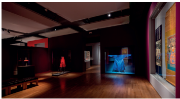
Gesichter Chinas. Porträtmalerei der Ming- und Qing-Dynastie (1368–1912), Ausstellungsansicht, 2017, © Staatliche Museen zu Berlin / David von Becker