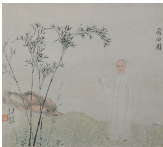
Yutang, Heilung der Vulgarität (Porträt des Gai Qi) , 玉堂 醫俗圖 (改琦圖像), Qing-Dynastie, 18. – 19. Jh., Hängerolle, Tusche und Farben auf Papier, Palastmuseum, Beijing, XIN 147371