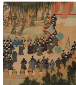
Yu Shi und Wu Yue, Die Beamtenlaufbahn des Xu Xianqing , 余士 吳鉞 徐顯卿宦蹟圖, Ming-Dynastie, Wanli-Ära (1573–1620), 1588, Album mit 26 Blättern, Tusche und Farben auf Seide, Palastmuseum Beijing, XIN 77917, © The Palace Museum, Foto: Yu Ningchuan

Die honorarfreie Reproduktion ist nur im Rahmen der aktuellen Berichterstattung zur Ausstellung bei Nennung der vollständigen Creditline erlaubt. Bei jeder anderweitigen Nutzung sind Sie verpflichtet, selbstständig die Fragen des Urheber- und Nutzungsrechts zu klären. Eine Weitergabe an Dritte ist nicht erlaubt. Bitte beachten Sie , dass bei digitaler Veröffentlichung alle Fotos die Auflösung von 758 x 512 Pixel und 72 dpi nicht überschreiten dürfen. Die Pressefotos sind 4 Wochen nach Ablauf der Ausstellung aus allen Onlinemedien zu löschen. Mit freundlicher Bitte um Zusendung eines Belegexemplars an die Pressestelle der Staatlichen Museen zu Berlin.