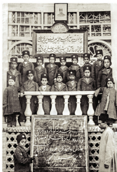
Schülergruppe mit Lehrer , Roshdiyye Schule, Täbris, Ende 19. / Anfang 20. Jh., © Nationalarchive Irans, Teheran