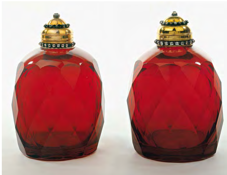
Facettierte Deckelflaschen, um 1700. Rubinglas, vergoldete Kupferfassung mit eingelegtem Glas oder Bergkristall, Höhe: 16,9/16,5 cm, Durchmesser: 9,6/9,9 cm. Kunstgewerbemuseum.

Die Sektion »Schöpfer« wendet sich dem Alchemisten als Kreator zu, der mit dem ausgehenden Mittelalter die Bühne der Kunst betritt. War die Alchemie in ihrer Frühzeit vor allem die Kunst, die dazu diente, die Natur so gut wie möglich nachzuahmen, und die dadurch im kunsthandwerklichen Bereich zu spektakulären Errungenschaften und Ergebnissen führte, ist jetzt die Kreativität des alchemistischen Künstlers, sein Wirken als Schöpfer Gegenstand der Betrachtung. Nun kann es nicht mehr alleine darum gehen, die Natur mithilfe der Alchemie zu imitieren, wie dies noch Albertus Magnus postulierte; der Alchemist der Neuzeit will die Natur neu erschaffen, er will sie kreieren, er erzeugt seine eigenen Welten und sein eigenes Leben. Ziel seines Strebens ist der sogenannte Stein der Weisen, jener magische Alleskönner, der sowohl in kristalliner Form, zu einem Pulver zerrieben oder als Flüssigkeit (Elixier oder Tinktur genannt) auftreten und mithilfe dessen Blei in Gold verwandelt werden kann – der darüber hinaus aber auch allerlei Krankheiten heilt, Mineralien in Edelsteine transmutiert und Glas in beliebiger Weise Gestalt annehmen lässt, wie es in der alchemistischen Bilderhandschrift »Splendor Solis« heißt. Allein schon in der Verfolgung dieses Zauberwerkzeugs, dieses ultimativen Mittels, schwingt sich der Mensch zum Schöpfer auf, rückt der