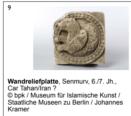
Wandreifplatte , Senmurv, 6./7. Jh., Car Tahan/Iran ?

Pressefotoanfragen pressebilder@smb.spk-berlin.de