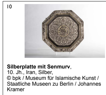
Silberplatte mit Senmurv , 10. Jh., Iran, Silber, © bpk / Museum für Islamische Kunst / Staatliche Museen zu Berlin / Johannes Kramer

Die honorarfreie Reproduktion ist nur im Rahmen der aktuellen Berichterstattung zur Ausstellung bei Nennung der vollständigen Creditline erlaubt. Bei jeder anderweitigen Nutzung sind Sie verpflichtet, selbstständig die Fragen des Urheber- und Nutzungsrechts zu klären. Eine Weitergabe an Dritte ist nicht erlaubt. Bitte beachten Sie , dass bei digitaler Veröffentlichung alle Fotos die Auflösung von 758 x 512 Pixel und 72 dpi nicht überschreiten dürfen. Die Pressefotos sind 4 Wochen nach Ablauf der Ausstellung aus allen Onlinemedien zu löschen. Mit freundlicher Bitte um Zusendung eines Belegexemplars an die Pressestelle der Staatlichen Museen zu Berlin.