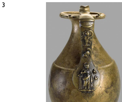
3 Griff eines Weinkruges aus dem Fund von Neupotz mit einer Darstellung der Göttin Minerva