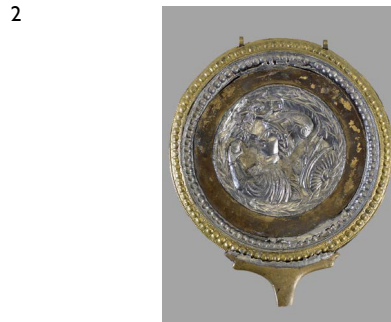
2 Rückseite eines Spiegels aus dem Fund von Neupotz mit der Darstellung der Göttin Minerva, Breite etwa 18 cm