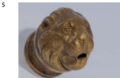
5 Bronzener Wasserspeier von einem Brunnen in Form eines Löwenköpfchens aus dem Fund von Neupotz, Länge etwa 8 cm