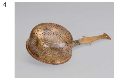
4 Sieb , 16 solcher Siebe sind im Schatzfund von Neupotz enthalten, alle sehen einander sehr ähnlich