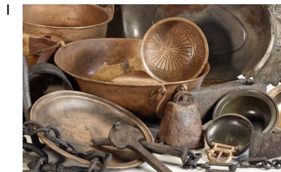
1 Querschnitt durch das Spektrum des Schatzfundes von Neupotz, 2. Hälfte 3. Jh. n. Chr.

Pressefotoanfragen pressebilder@smb.spk-berlin.de