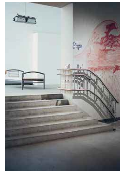
Wandkunst: Im Museum Europäischer Kulturen entsteht die Ausstellung „daHEIM: Einsichten in flüchtige Leben“, die am 22. Juli 2016 eröffnet und bis zum 2. Juli 2017 zu sehen sein wird