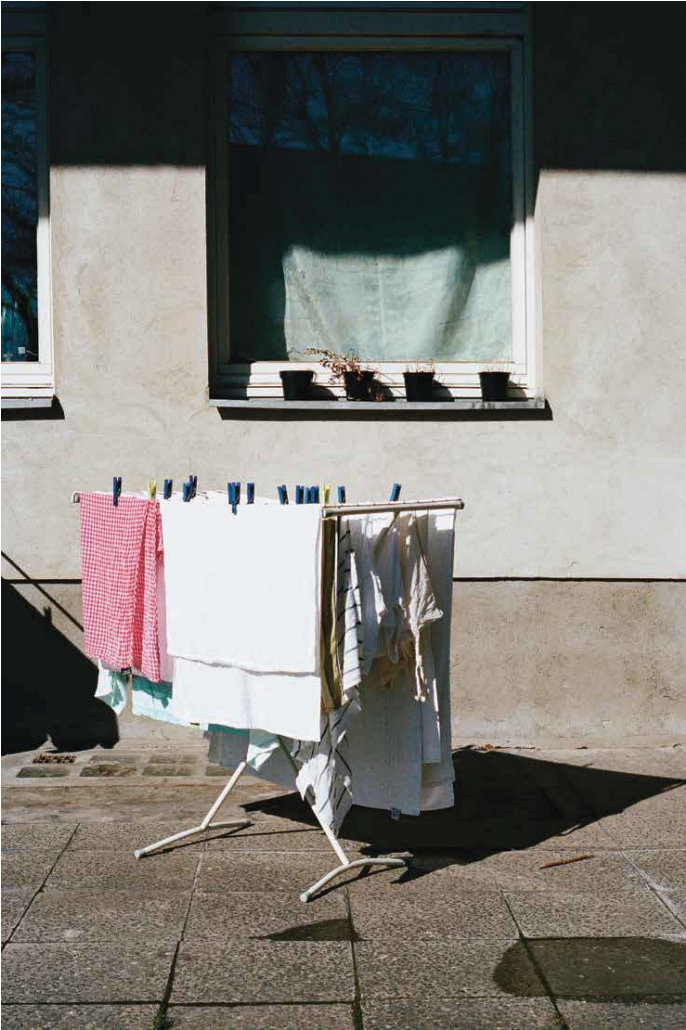
Genormtes Warten: Wohnheim in Spandau