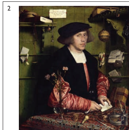
Hans Holbein d. J.: Der Kaufmann Georg Gisze, 1532, Öl auf Eichenholz, 97,3 x 86 cm