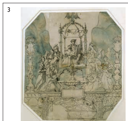
Hans Holbein d. J.: Der Parnass , 1533, Feder in Schwarz, Pinsel in Grau und Blaugrau über Vorzeichnung mit schwarzem Stift, 42,3 x 38,3 cm