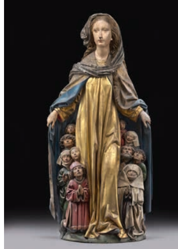
Michel Erhart, Maria mit dem Schutzmantel , um 1480, Lindenholz, ursprüngliche Farbfassung, 135 x 62 x 36 cm

Die honorarfreie Reproduktion ist nur im Rahmen der aktuellen Berichterstattung zur Ausstellung bei Nennung der vollständigen Creditline erlaubt. Bei jeder anderweitigen Nutzung sind Sie verpflichtet, selbstständig die Fragen des Urheber- und Nutzungsrechts zu klären. Eine Weitergabe an Dritte ist nicht erlaubt. Bitte beachten Sie , dass bei digitaler Veröffentlichung alle Fotos die Auflösung von 758 x 512 Pixel und 72 dpi nicht überschreiten dürfen. Die Pressefotos sind 4 Wochen nach Ablauf der Ausstellung aus allen Onlinemedien zu löschen. Mit freundlicher Bitte um Zusendung eines Belegexemplars an die Pressestelle der Staatlichen Museen zu Berlin.