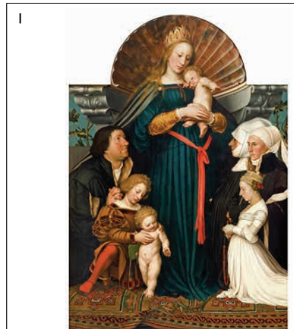
Hans Holbein d. J.: Die Madonna des Bürgermeisters Jakob Meyer zum Hasen, 1526/28, 146,5 x 102 cm, Nadelholz

Pressefotoanfragen pressebilder@smb.spk-berlin.de