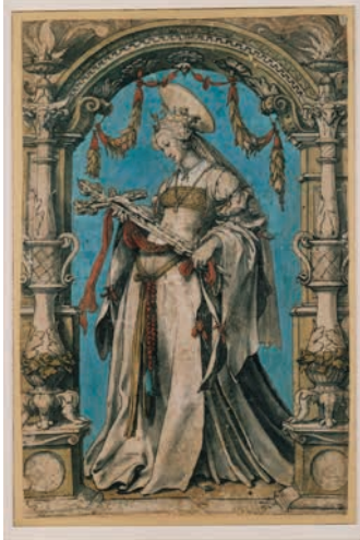
Hans Holbein d. J.: Die Hl. Kunigunde mit dem Kreuzifix , Vorlage für ein Glasgemälde, um 1528–1532, Feder in Schwarz, grau laviert, Pinsel in Grau, Rot, Rosa, Blau und Grün, 31,6 x 20,6 cm