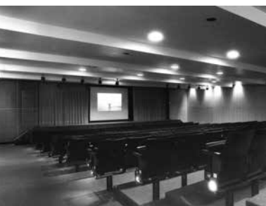
© Staatliche Museen zu Berlin, EM

1933, Wamba, Belgian Congo. A man and his clan are accused of brutally murdering accomplices of the colonial occupying power during the night. "The Mbako Trial: Myth and Reality" traces the little-documented history of the Anioto Leopard Men, a secret militia that carried out the judgments of traditional leaders and killed their victims with claw-like knives. To the colonial rulers, their leader Mbako was a terrorist; to the Congolese, a hero of the resistance. Using a mix of reenactments, animations, and interviews, the film examines the trial of Mbako, who was ultimately hanged.