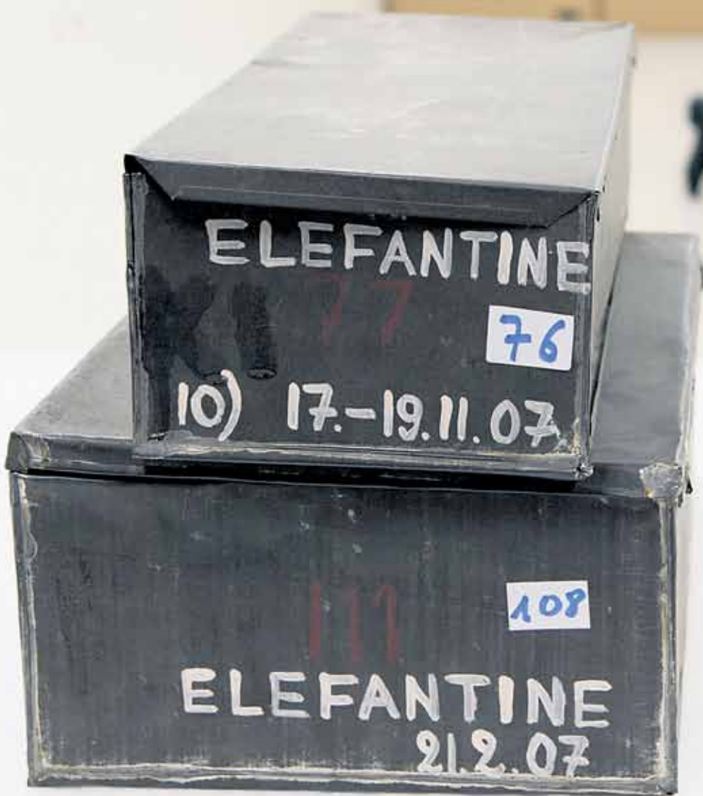
In solchen Metallkisten kamen die Papyri von Elephantine zwischen 1906 und 1908 nach Deutschland

Projektes außerhalb der Wissenschaften fragt. „Wir können viel aus ihr lernen – für die Gegenwart, aber auch für die Zukunft.“