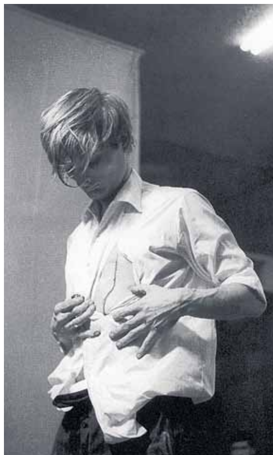
Günter Brus: Wiener Spaziergang Innenstadt, 1010 Wien 5. Juli 1965