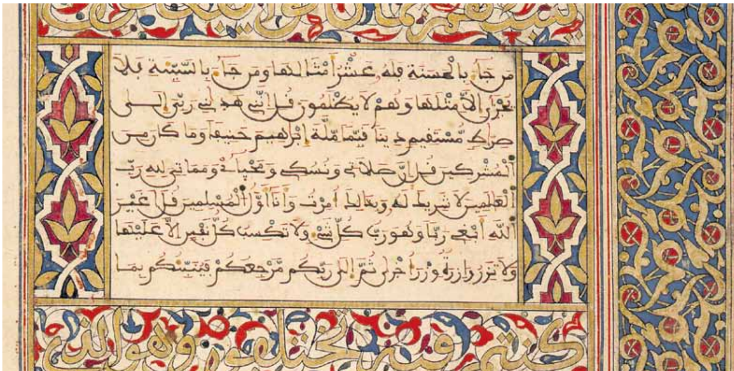
Blatt aus dem Oppenheim Koran (Detail) 15. Jahrhundert

Für Muslime repräsentiert der Koran die Begegnung des Gläubigen mit der göttlichen Botschaft, die dem Propheten Muhammad von dem Erzengel Gabriel zwischen den Jahren 610 und 632 überliefert wurde.