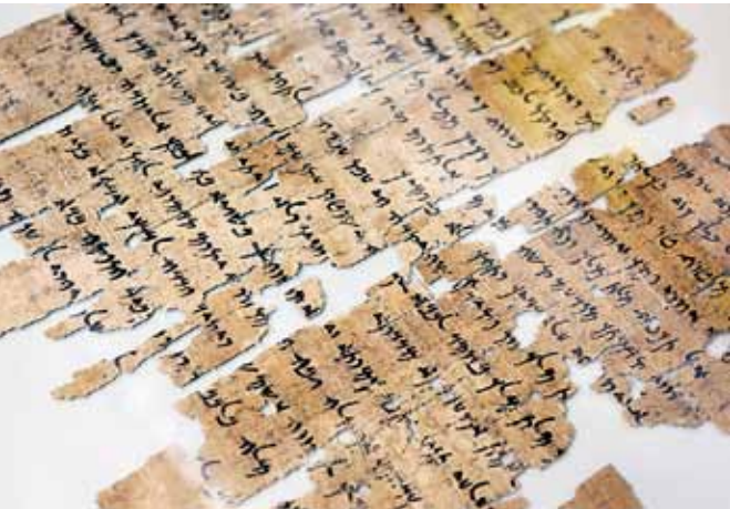
Oben: Einer der vielen Papyri, die Lepper und ihre Mitarbeiter entschlüsseln und in eine Datenbank einspeisen. Unten: Aramäisch ist nur eine der zahlreichen alten Sprachen, in denen die Papyri von Elephantine verfasst sind.