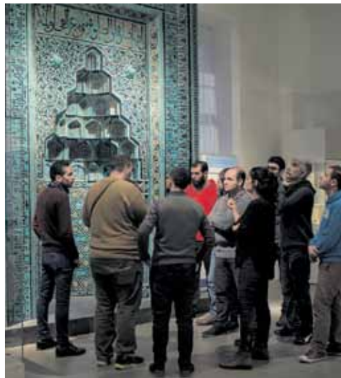
Teilnehmer eine Multaka-Führung im Vorderasiatischen Museum.

Im Projekt „Multaka: Treffpunkt Museum – Geflüchtete als Guides in Berliner Museen“ werden syrische und irakische Geflüchtete zu Museums-Guides fortgebildet und bieten Führungen in ihrer Muttersprache für andere Geflüchtete an. Multaka (arabisch: Treffpunkt) steht dabei auch für den Austausch verschiedener kultureller und historischer Erfahrungen. Mit dem Kooperationsprojekt zwischen dem Museum für Islamische Kunst, dem Vorderasiatischen Museum, der Skulpturensammlung und Museum für Byzantinische Kunst sowie dem Deutschen Historischen Museum positionieren sich die Staatlichen Museen zu Berlin in der aktuellen Debatte klar für eine offene Gesellschaft, die allen Menschen die Chance bietet, anzukommen und sich einzubringen.