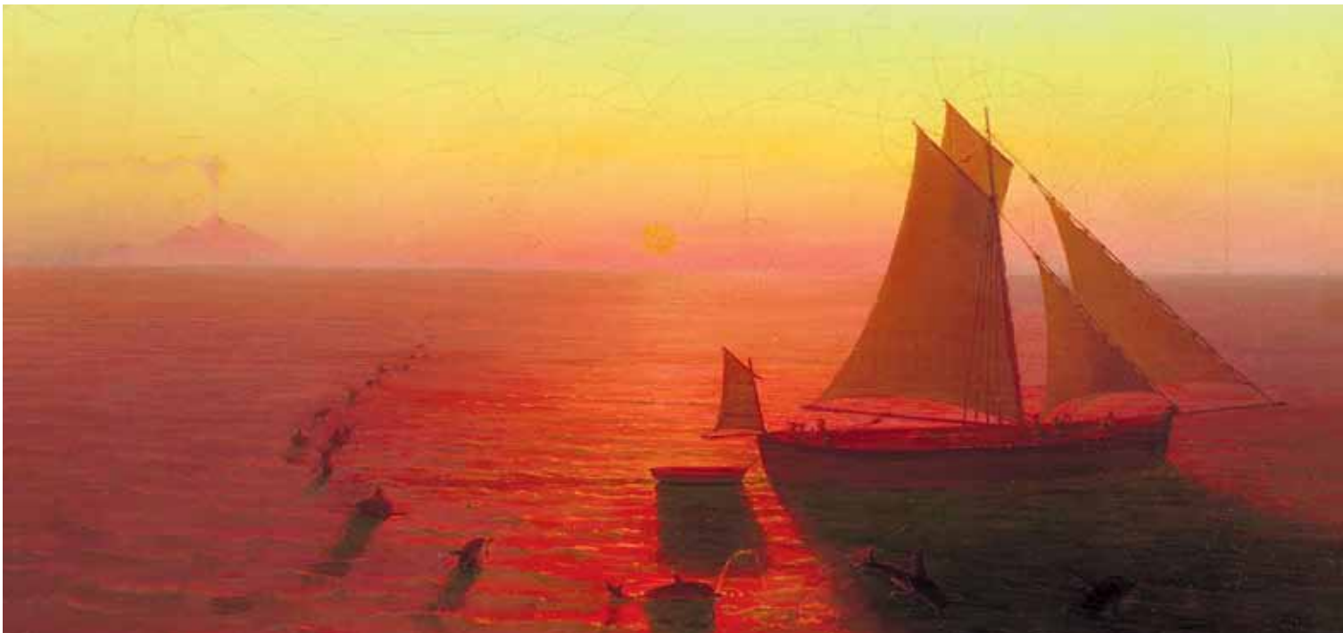
August Kopisch: Ein Schiff auf dem Meere von Delphinen umschwärmt (Detail) 1826/28

Mit der Ausstellung „August Kopisch – Maler, Dichter, Entdecker, Erfinder“ rückt die Alte Nationalgalerie eine der vielseitigsten Künstlerpersönlichkeiten der ersten Hälfte des 19. Jahrhunderts in den Fokus. Wie kein Zweiter hat Kopisch (1799 – 1853) in seinem Werk Malerei, Dichtung, Forschergeist und Erfindungskraft vereint. Er machte sich einen Namen, als er 1826 auf der Insel Capri die Blaue Grotte entdeckte, die seither ein Magnet für Touristen ist. Als Maler schuf Kopisch Bilder von ganz eigener poetischer Strahlkraft. Magisches Blau oder schwelgerisches Sonnenuntergangsrot waren seine bevorzugten Farben, mit denen er Lichtphänomene eindrucksvoll wiedergab. Zu seinen literarischen Hauptwerken zählt die metrische Übersetzung von Dantes „Göttlicher Ko-