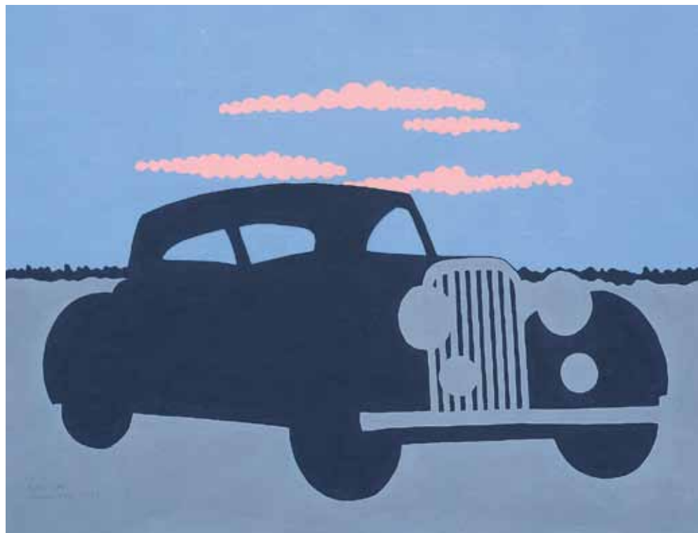
Eduard Hildebrandt: Peking: Tientsin 1863