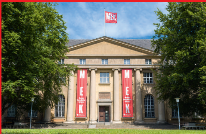
Eingang des MEK, Arnimallee 25

unterschiedlicher Herkunft sowie die Folgen dieser Kontakte für die Gesellschaft in Vergangenheit und Gegenwart. Dabei betrachten wir Kultur und Identität als dynamisch, fließend und vielfältig. Beides hängt eng zusammen und verändert sich, wenn Menschen sich begegnen. Dies möchten wir sichtbar machen. Darum fühlen wir uns auch dem Sammeln der Gegenwart und der Zusammenarbeit mit unterschiedlichen Menschen und Gruppen verpflichtet. So begleiten wir aktuelle soziale und kulturelle Prozesse. Wir wollen interkulturelles Verständnis fördern, um Vorurteile und Stereotype abzubauen.