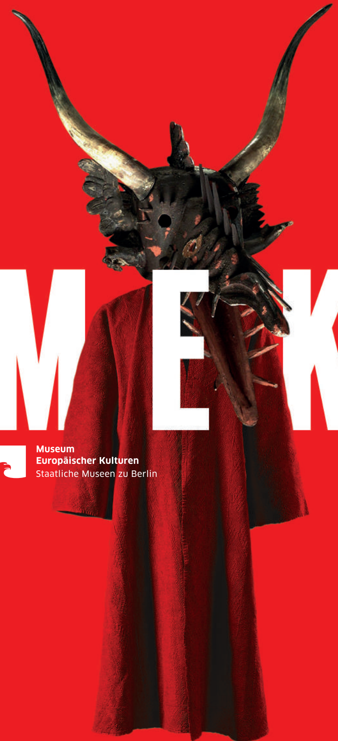
Titelcollage: Salzburger Perchtenmaske, 18. Jh., Österreich Obergewand eines krimtatarischen Mullah, Ende 19. Jh., Ukraine (damals Russland)

Museum Europäischer Kulturen Staatliche Museen zu Berlin