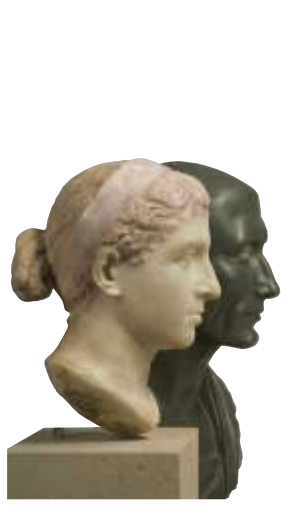
Porträts von Cleopatra und Caesar