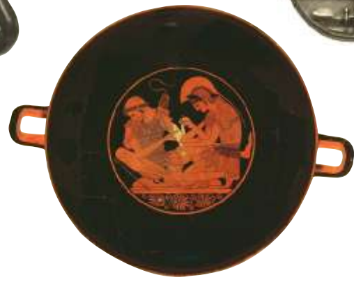
Trinkschale des Töpfers Sosias