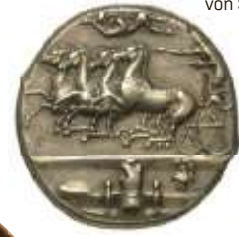
Dekadrachme von Syrakus