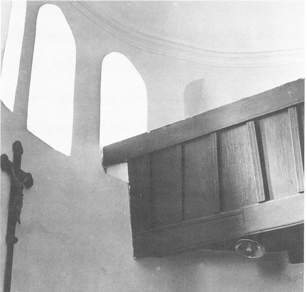
Abb. 4: Innenansicht der Kirche, Anschluß der Holzgalerie an die Rundmauern. Es ist gut zu beobachten, daß die Galerie später eingebaut wurde, da die Fenster teilweise eingemauert wurden.

Zur Klärung der Fragen entnahmen wir zehn Ziegel aus der Wand und aus der Treppe. Die TL-Datierung wurde mit dem Quartz-Inklusionsverfahren gemacht. Die Ergebnisse gaben Antworten auf alle Fragen.