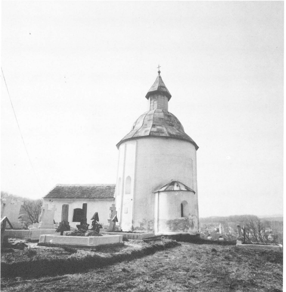
Abb. 1: Die Rundkirche von Kallósd, von der Ostseite.

Die mittelalterliche Kirche, die wir am meisten untersucht haben – zehn unabhängige Proben über mehrere Jahre –, ist die romanische Rotunda von Kallósd in West-Ungarn (Abb. 1). Die baugeschichtlichen Forschungen halten diese für einen der gruppenbil-