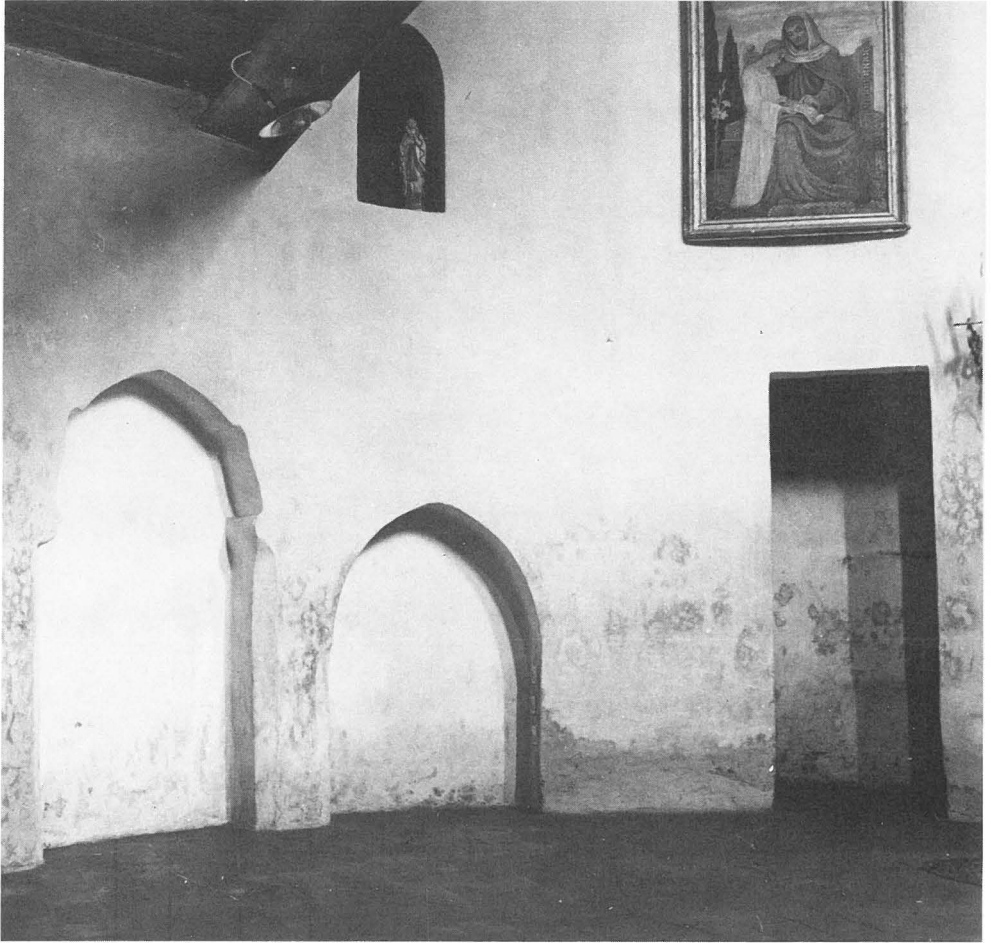
Abb. 3: Innenansicht der Kirche. Rechts sichtbar die Nische, von wo die Treppe hinaufführt.