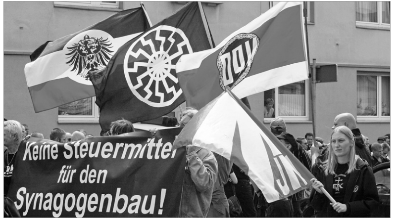
Abb. 4: Flagge mit Schwarzer Sonne auf einer Demonstration extrem Rechter.