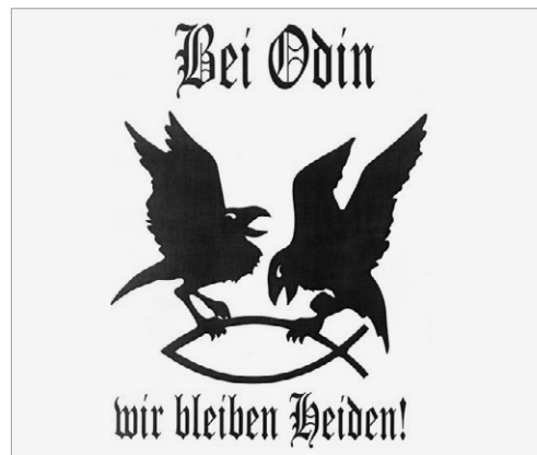
Abb. 2: Extrem rechter Szenegänger mit einer Tätowierung zweier auf einem Fisch hockenden Raben. Die Raben haben den Fisch getötet und fressen ihn. Die Tätowierung greift das extrem rechte Bekenntnis »Bei Odin, wir bleiben Heiden!« auf.