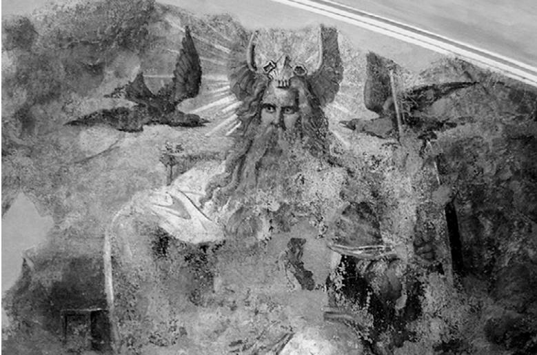
Abb. 1: Fries im »Saal der nordischen Altertümer« des Museums für Vor- und Frühgeschichte. Dargestellt ist Odin zusammen mit seinen mythologischen Waffen und Begleitern.